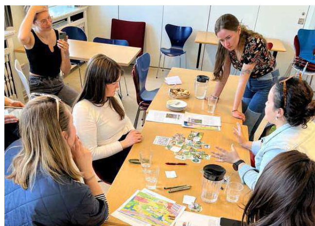
Fremtidsworkshop om den bæredygtige by med studerende fra Aalborg Universitet.