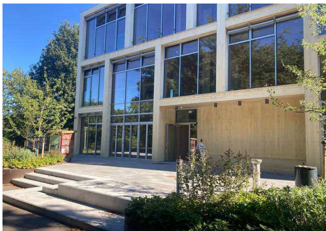
Nye lokaler i Kildevæld Kulturcenter. Miljøpunkt Østerbro flyttede i september til nye lokaler i Kildevæld Kulturcenter.