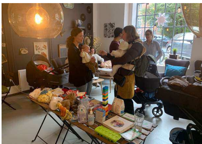
Barselscafé om skadelig kemi i hverdagen og bæredygtigt forbrug i loppesupermarkedet Lidkøb.