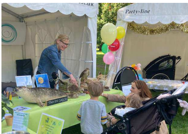
Østerbroweekend i Fælledparken med pandekager med sankede planter fra parken, quiz om lokale dyr og meget mere.