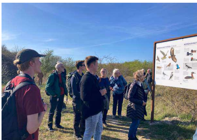
Guidet fugletur på Nordhavnstippen sammen med Nordhavns Naturvenner og DOF UNG.