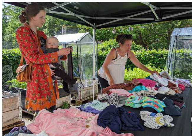
Byttemarked med babytøj- og udstyr på den bemandede legeplads i Kildevældsparken.