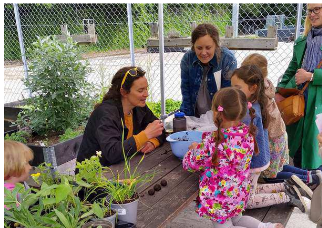
Planteworkshop til Biens Dag på den bemandede legeplads i Kildevældsparken. Her fik en masse børn lært om bynatur og plantet bivenlige planter.