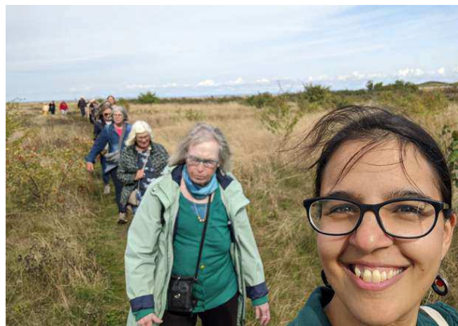
Bynaturvandring på Nordhavnstippen for seniorer sammen med Nabo Østerbro.