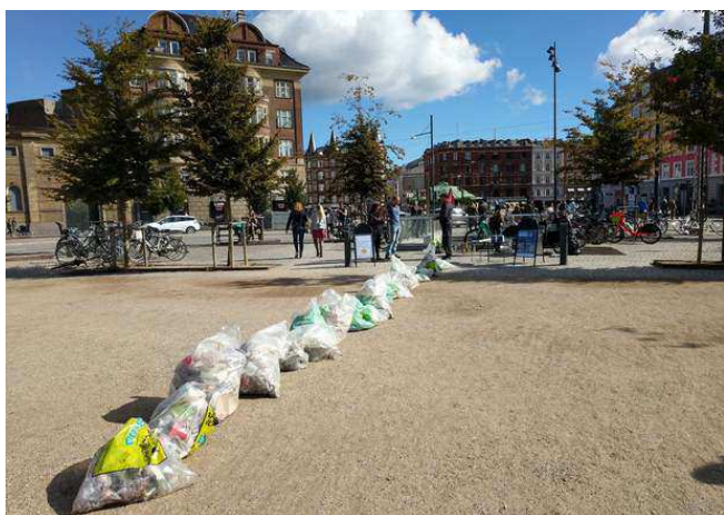
Affaldsindsamling ved Trianglen til World Cleanup Day. Der blev samlet mere end 45 kilo skrald på 2 timer.