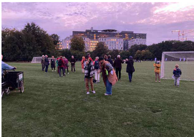
Flagermusture i Fælledparken i august og september med fokus på biodiversitet og lysforurening. Vi lyttede efter flagermus og kiggede efter BUGS i trækroneerne.