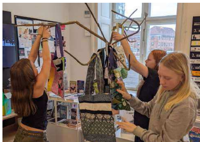
Fortsat gang i Plastikposefrit Østerbro, bl.a. med indvielse af posebyttetræer på Øbro Jagtvej Bibliotek og Biblioteket på Dag Hammarskiolds Alle.