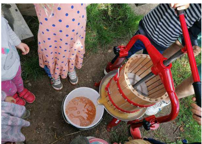
I sommer/efterårsperioden er der godt gang i udlån af vores æblemosteri, så man kan lave havens æbler til æblemost.