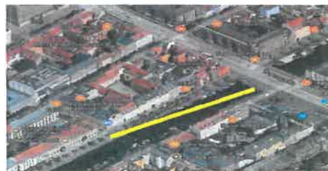
Skulpturens geografiske placering og dens kig ned mod motorfabrikken

Vi ønsker at opstille en naturalistisk skulptur af en B&W-arbejder, der skal stå og skue ud over Christianshavns Kanal ned mod de gamle B&W haller. Vi forestiller os, at skulpturen skal placeres på Børnehusbroen (det var her arbejderne, kaldet "De blå Mænd" ofte stod i frokostpausen midt på Christianshavn.