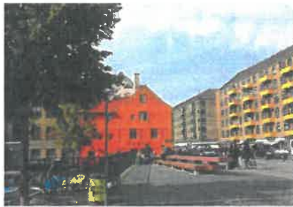
Børnehusbroen set fra Ovengaden Oven Vandet Skulpturen tænkes opstillet ved rødværket bag papirkurven