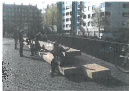
Bænken hvor skulpturen tænkes placeret i baggrunden. Her kan mennesker sidde i selskab med skulpturen og dens historie