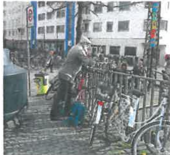
Illustration af skulpturens placering og stilling