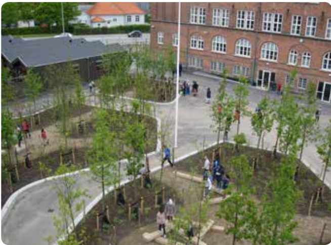
Amager Fælled Skole har fået landets første skovskolegård. Træerne er med til at danne ramme om spændende leg- og læringsmiljøer.