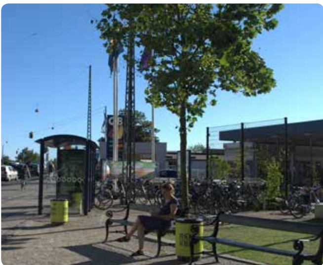
Træ der indgår i sammenhæng med de andre funktioner i byens rum.