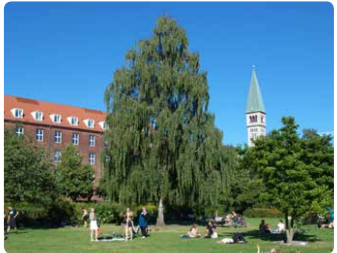
I byens parker er der plads til, at de store flotte solitære træer kan 'folde sig ud'. Parktræerne er med til at danne rammer for parkens rekreative funktioner, som det ses her i Enghaveparken.