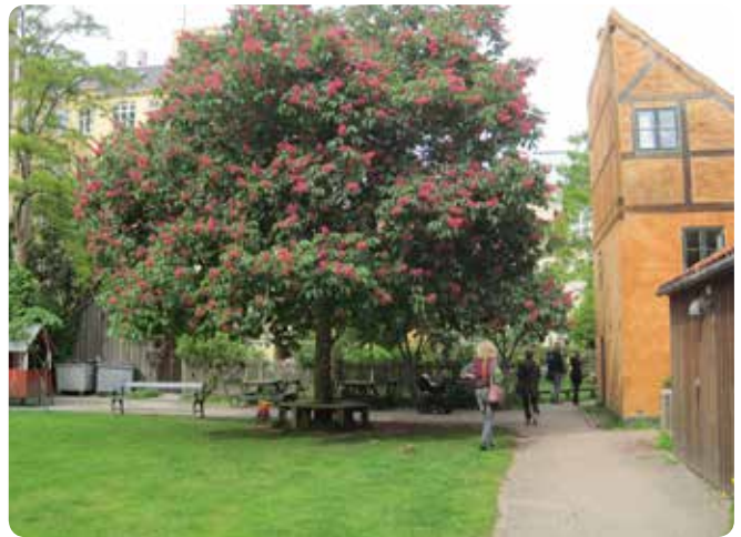
I mange af Københavns fælles gårdhaver gror der store træer, der giver gårdrummene en hel særlig karakter og identitet, som det ses her i en gårdhave på Christianshavn.