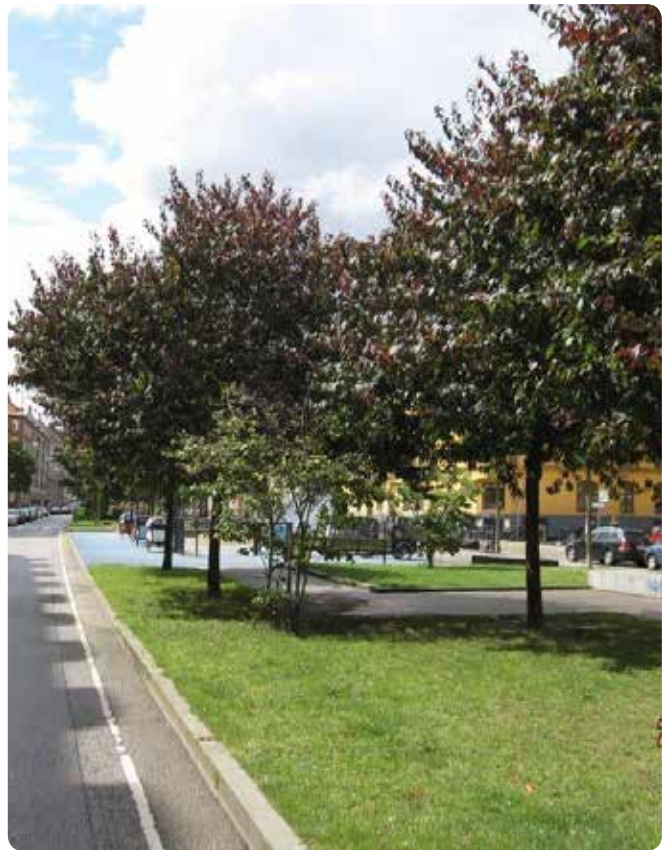
I forbindelse med renoveringen af Sønder Boulevard blev der plads til/bevaret træer, som er med til at skabe læ og skygge. Træerne er med til at skabe et trygt rum til ophold væk fra vejen