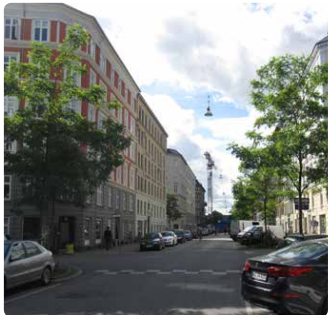
Ovenfor ses to billeder af den samme gade – uden gadetræer og med gadetræer.