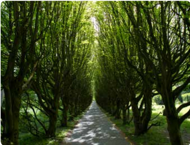
Træer er med til at skabe kulturhistorisk værdi og giver samtidig også naturoplevelser, som her på Vestre Kirkegård.