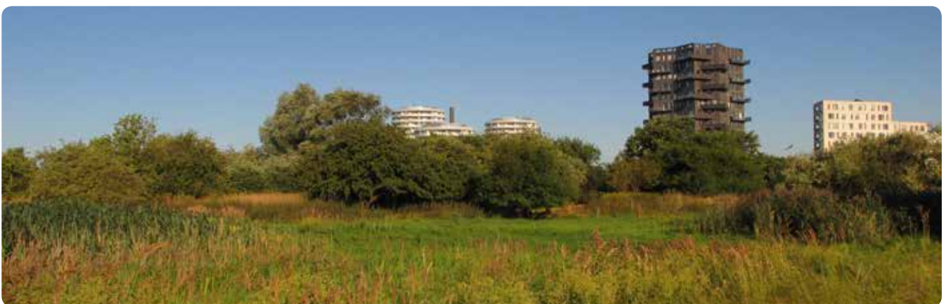
Træer i naturområder er ofte hjemmehørende arter. De er derfor vigtige bidragsydere i forhold til at øge den biologiske mangfoldighed, da de hjemmehørende arter er hjemsted for mange insekter og svampe.