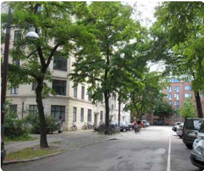
Gadetræer langs Tøndergade på Vesterbro.