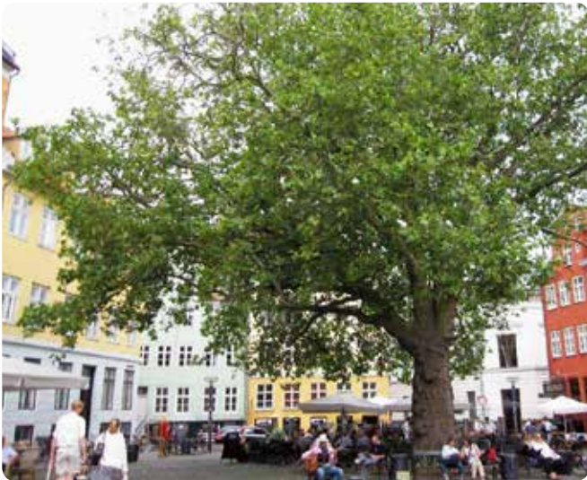
På Gråbrødretov står et gammelt Platantræ, der er identitets- skabende for torvet.