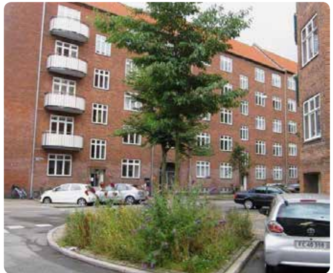
Gadetræ med underbeplantning.