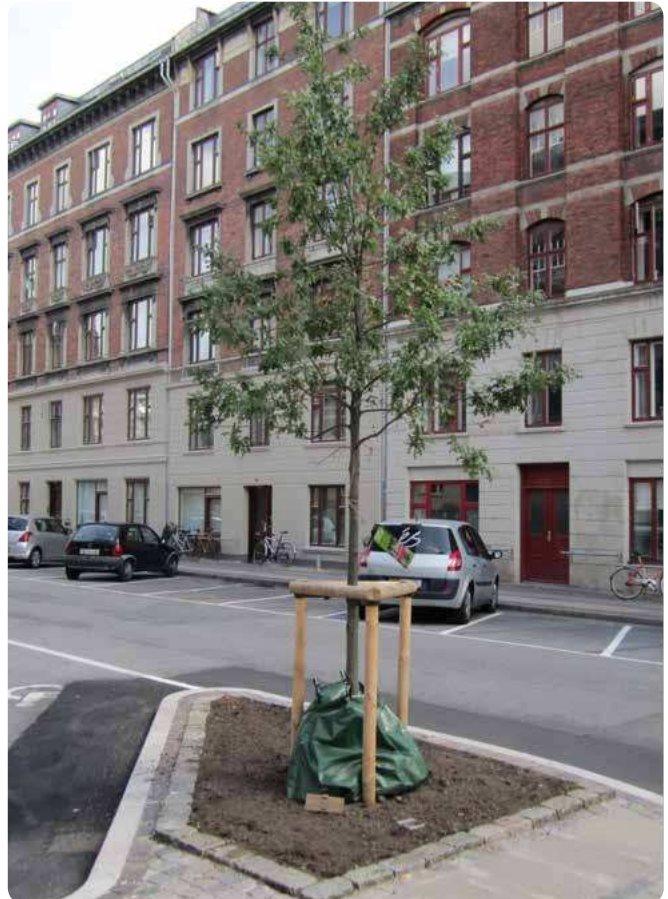
Eksempel på udnyttelse af byens rum til plantning af et nyt træ i et boligkvarter.