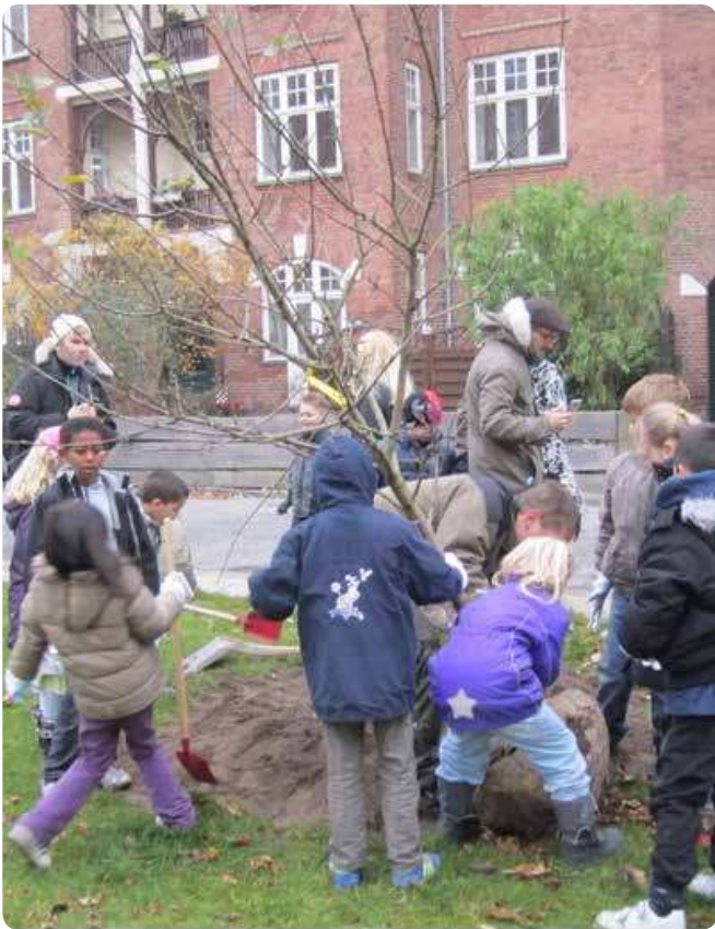
Skolebørn planter 'deres træ' i samarbejde med en gartner fra Teknik- og Miljøforvaltningen.