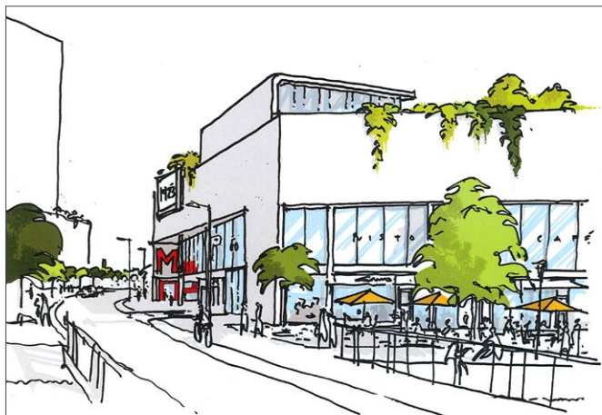
Skitsetegning af det nye Fisketorv set fra syd med café og restaurant-området ved "kanalen". (Illustration BAU)

har skabt øget beskæftigelse og vækst. Med udbygningen af Metrolinjen opnås maksimale transportmæssige fordele, hvorved behovet for privatbilisme begrænses.