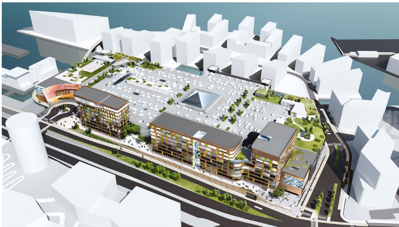
Skitseprojekt / luftbillede af kontor- og hotelbygninger langs Kalvebod Brygge set fra vest mod øst. En terrænuvling fjerner varetansportsområdet skakt/mellemrum mellem rampen op til Fisketorvet og Fisketorvets facade langs Kalvebod Brygge, og skaber et bedre flow for fodgængere og trækker bylivet hen mod metrostationen. Yderst i højre hjørne ses Skanskas forslag til erhvervshus. (Illustration BAU)

København vil være verdens første CO 2 -neutrale hovedstad i 2025, og dette skal ske samtidig med, at kommunen