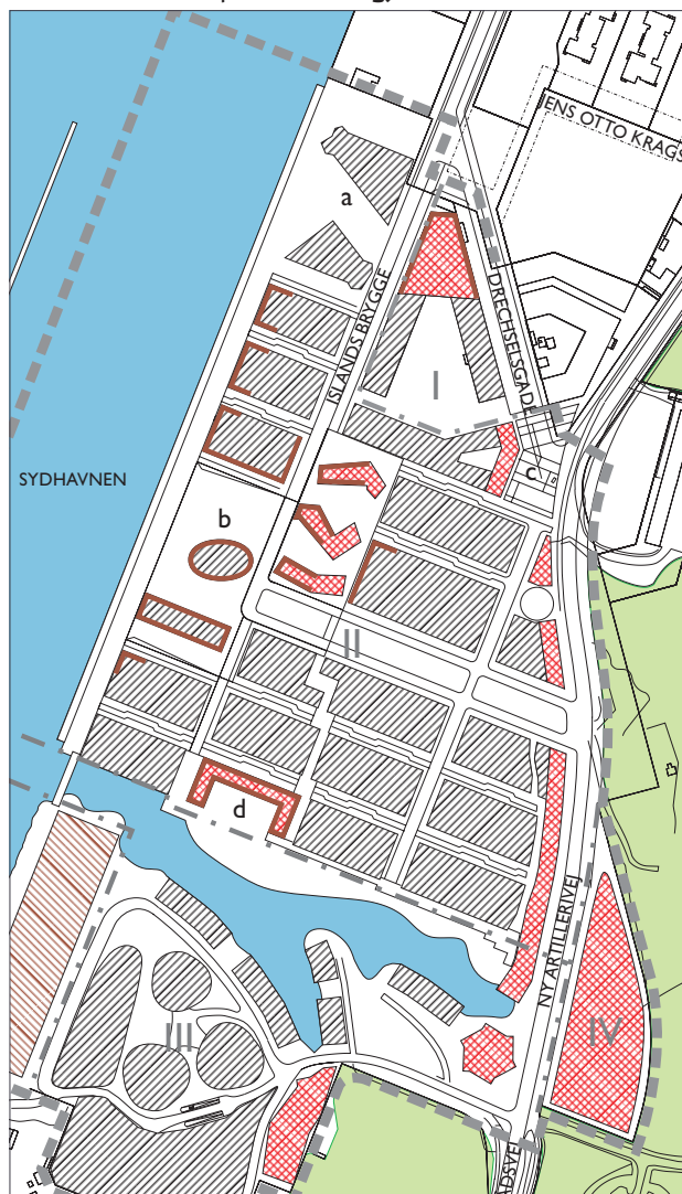
Publikumsorienterede serviceerhverv mv. i stueetagen