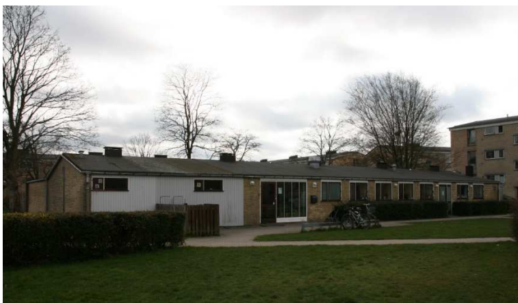
Den fritliggende fløj set fra nord