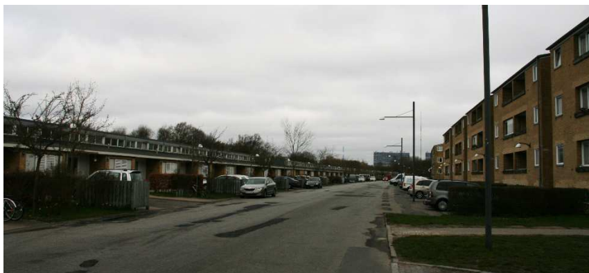
Rækkehuset set fra syd langs Langhusvej

Bygningen er i sig selv en flot og markant bebyggelse, men adskiller sig i bygningsform, og i placeringen i den vestlig udkant på den anden side af en bred vej fra den øvrige bebyggelse, så den forekommer ikke at være helt så integreret i bebyggelsen, og samtidig med at den afgrænser bebyggelsen spærrer den delvis også for udsyn og adgang til bagvedliggende grønne områder, hvortil der kun er adgang via et par gennemgange.