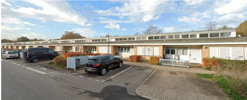
Udsnit af rækkehusets nordlige østfacade