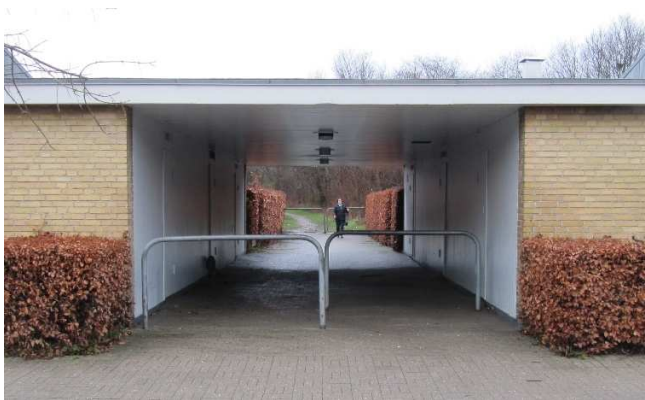
En af de to gennemgange fra Langhusvej til de grønne arealer