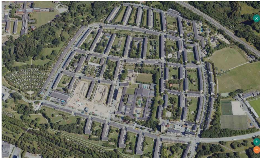
Luftfoto af bebyggelsen set mod nord