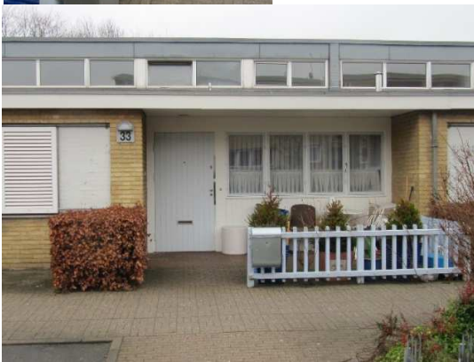
De enkelte boliger er markeret af tilbagetrukne indgangspartier