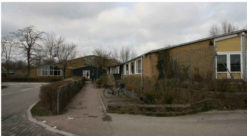
Bygningsanlægget set fra syd Terrasserne med gavlenderne af de to hovedfløje.

Med sin materialitet og tidstypiske arkitektur indskriver bygningerne sig i bebyggelsens helhed samtidig med at de skiller sig ud ved en skala i 1 etage og et lidt anderledes formsprog. Den langstrakte form gør at det samlede bygningsanlæg er lidt svært at få et samlet overblik på stedet, og sammen med den yderlige placering gør det at anlægget ikke opleves som helt så integreret i bebyggelsen som mange andre af bygningerne.