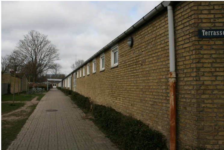
Den lange vestfacade af den vestlige af de to hovedfløje