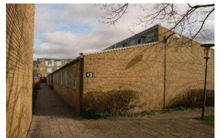
Institutionsbygninger i 1 etage og med forskudte tage