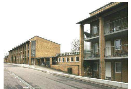
Arkaderne mod øst med en 1-etages institution

Tingbjerg er opført på grundlag af en bebyggelsesplan udarbejdet i 1950 af Arkitekt Steen Eiler Rasmussen i samarbejde med havearkitekt C. Th. Sørensen. I 1956 påbegyndtes byggeriet og størstedelen af bebyggelsen var færdigopført i 1970. I 2018 er der opført et kulturhus tegnet af arkitektfirmaet COBE. Bygården mod Ruten stod i medio 2020 færdigbygget med butikker og private boliger på det førhenværende Lille Torv.