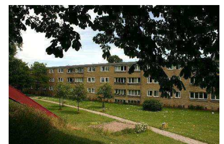
Terrænforskelle i haverum