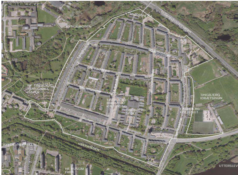
Luftfoto af Tingbjerg med lokalplanafgrænsningen markeret med hvidt.

Vejbetjening sker med et net af veje, der via et ringvejssystem (Ruten-Terrasserne-Gavlhusvej-Langhusvej) er koblet til det overordnede vejnet. For at undgå en monoton bydel har Steen Eiler Rasmussen søgt at gøre vejene så karakterfulde som muligt. Dette er løst ved at differentiere gadenettet, så hver vej og gade er udformet efter sin specielle placering og funktion inden for området, og ved at vejene krummer.