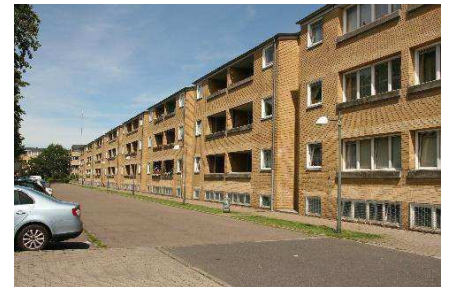
Facader mod gade med opdeling i mindre enheder

De miljømæssige bevaringsværdier knytter sig til byplanen og det særlige kurvede gadeforløb med den homogene og samtidig afvekslende bebyggelse i en menneskelig skala. Tilsammen giver dette både en sammenhæng og en variation med gadeforløb, der veksler med store grønne rum mellem boligblokkene med C. Th. Sørensens landskabsplan, og knytter sig på et mere overordnet plan til bebyggelsens samlede og sluttede karakter, der ligger som en meget klart defineret bebyggelse midt i de omkringliggende naturområder.