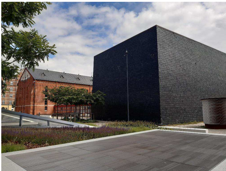
Arkivbygning tegnet af Martin Nyrop (th.) og magasinbygning tegnet af Eva og Niels Koppel (tv.).

overordnede bevaringsværdier. Stueetager kan derfor kun åbnes delvist, så der fortsat er stor tyngde i basen. Med bebyggelsesplanen sikres, at bygningen kan opleves fritliggende.