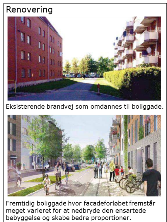
Eksisterende brandvej som omdannes til boliggade.