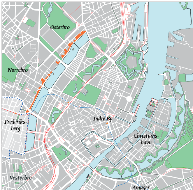
Lokalplanens placering i byen.