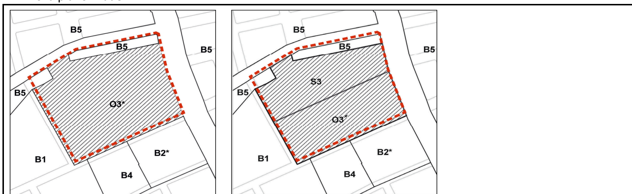
Kommuneplantillæg (område før) (område efter)