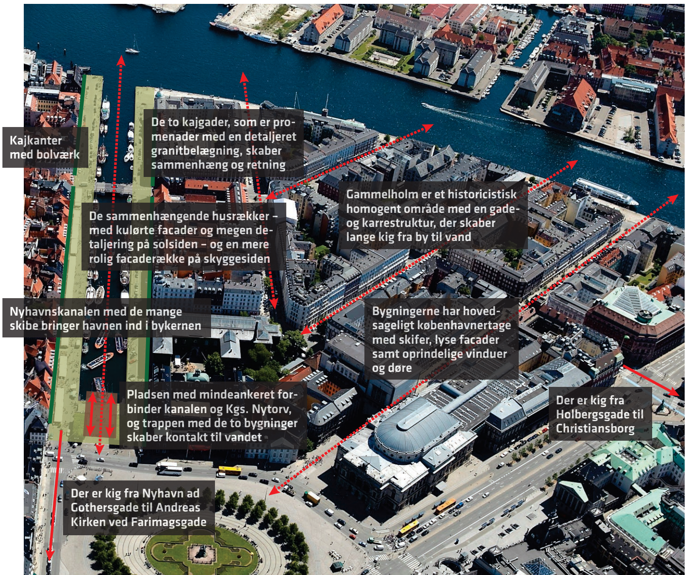
Egenarten for Nyhavnsområdet. Nyhavn forbinder havnen med byen og gadeforløbet i Gammelholm skaber kig fra land til vand. Både fra Nyhavn og Havnegade er der kig helt til Kgs. Nytorv. Området gennemskæres af Holbergsgade over Nyhavnsbroen til Toldbodgade.