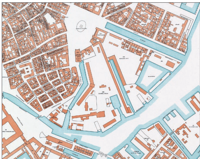
Nyhavn og Gammelholm i 1860 umiddelbart før ombygningen af Gammelholm blev påbegyndt. Man kan se, at området var en fritliggende holm, hvor gaden forbi Holmens Kirke stadig bærer sit navn efter Holmens Kanal.