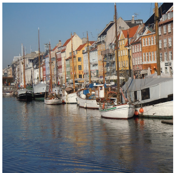
Egenarten på Nyhavns solsiden med de kulørte facader, huse i varierende højder samt stor detaljerigdom. Foran husrækken promenaden, bolværket og træskibe med master.