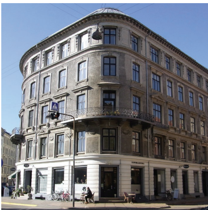
Egenarten i Gammelholm med de historicistiske facader med afrundede hjørner. De fleste ejendomme har stadig de oprindelige vinduer og døre.