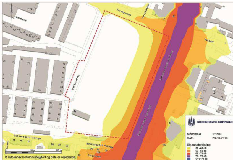
Trafikstøj målt i 1,5m højde i lokalplantillæggets område