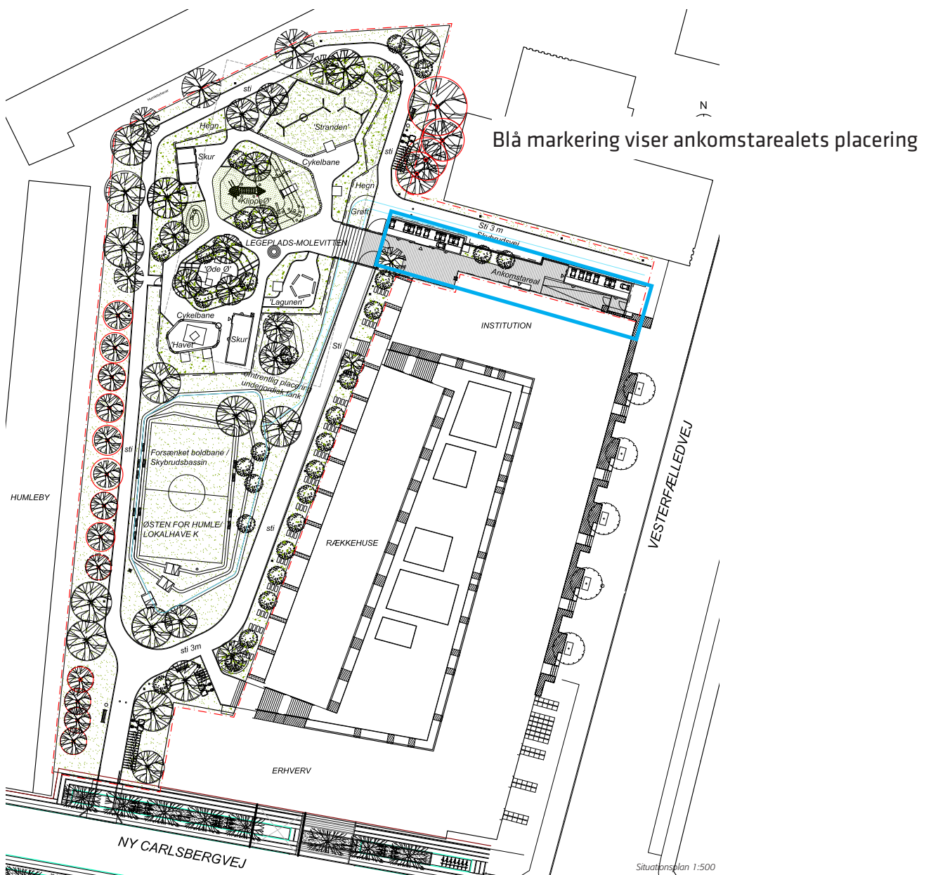
Blå markering viser ankomstarelets placering