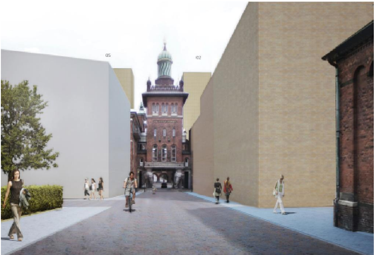
Illustration af ny bebyggelse mod Ny Carlsberg Vej. Karréens øverste etage er trukket tilbage nærmest Elefantporten.