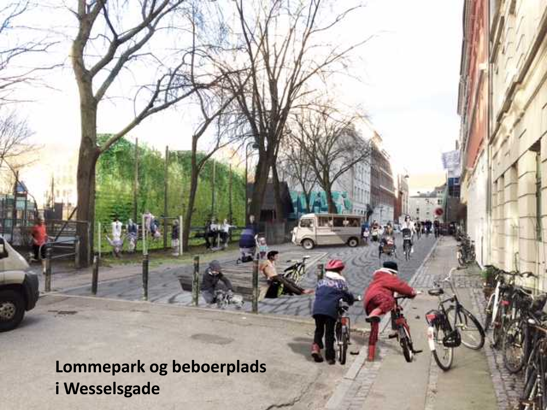
Lommepark og beboerplads i Wesselsgade