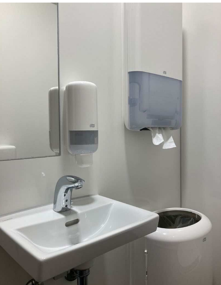
Spejl er smallere end håndvaskens bredde. På den måde sikres korrekt placering af sæbedispenser.

Toilettets inventar skal placeres hensigtsmæssigt med tanke på optimal adfærd og brug. Det gælder om at dryppe mindst muligt på gulvet efter at have vasket hænder, så oplevelsen af renhed sikres bedst muligt. Dertil skal inventar så vidt muligt væghænges, da det letter den daglige rengøring.