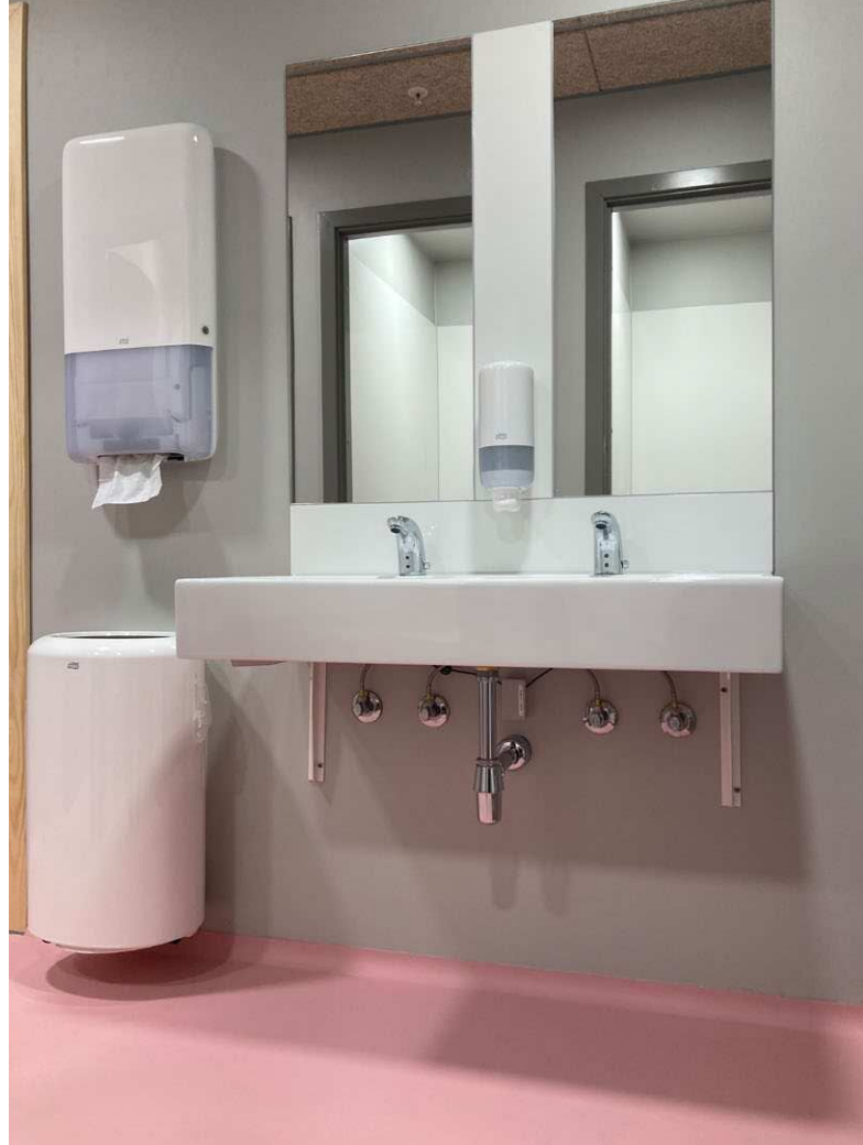
Her ses korrekt placering af inventar. Sæbedispenseren er placeret over vasken. Papirhåndklæder er placeret tæt ved vasken og over skraldespanden.