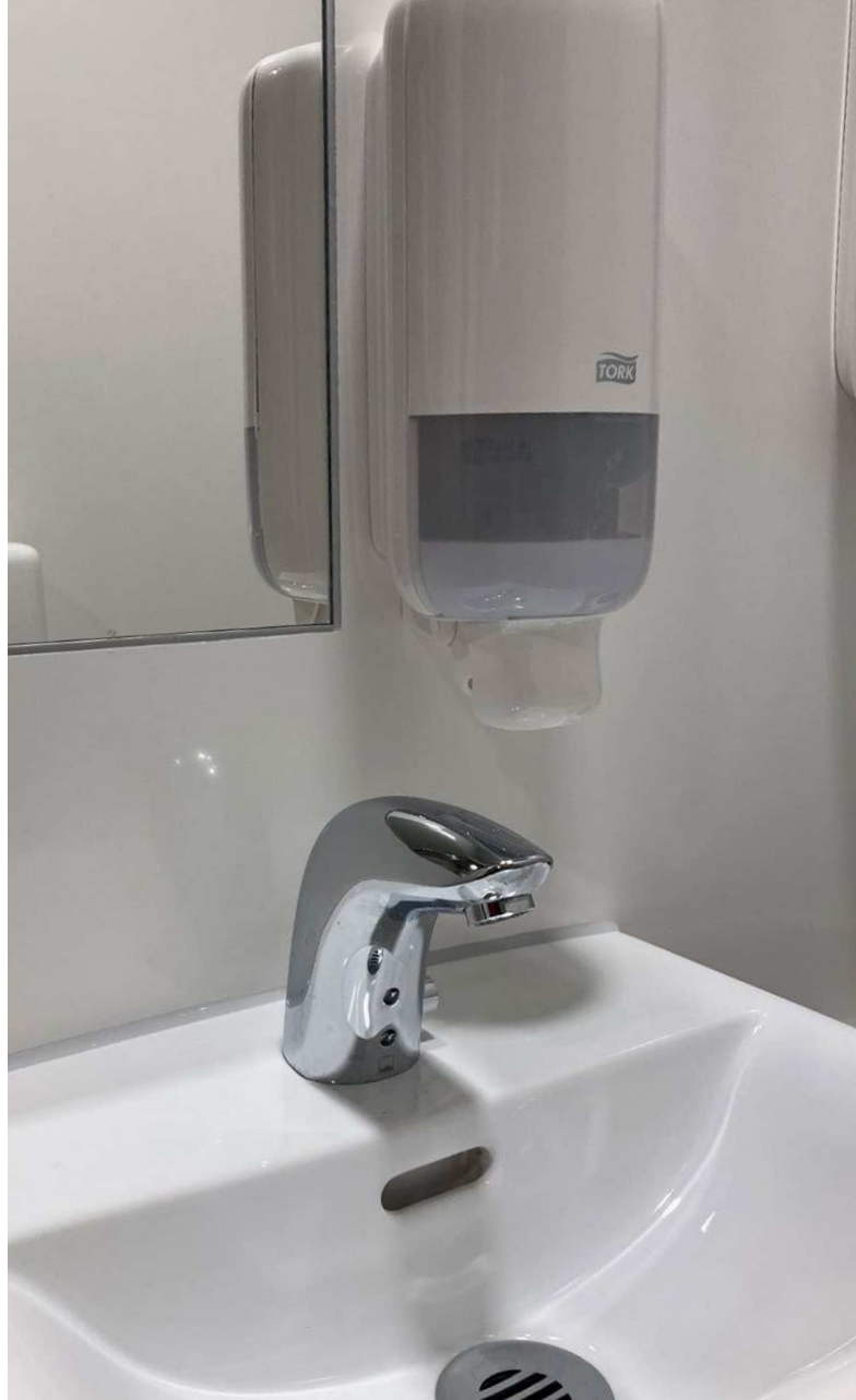
Håndfrie vandhaner optimerer hygiejneforhold og letter rengøringen.