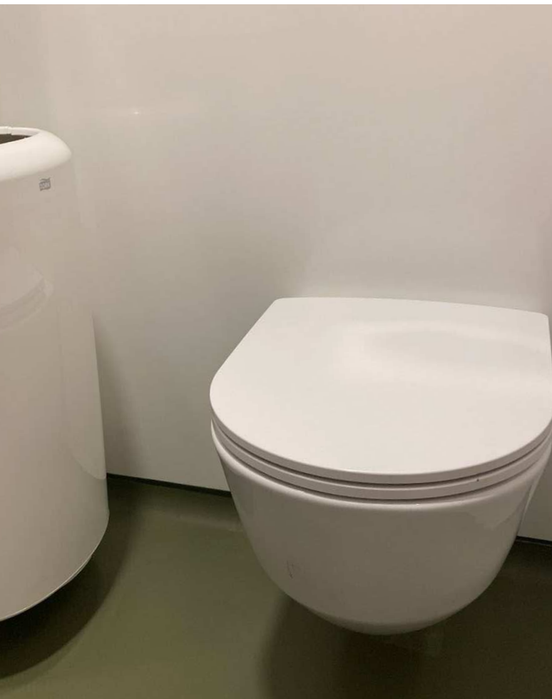
Et væghængt toilet minimerer rengøringsflader og rengøring af gulvet lettes.

Toilettets tekniske installationer bør udvælges med fokus på kvalitet, robusthed og med hensyn til teknisk drift. Rørføringer og tekniske installationer etableres så vidt muligt skjult, så ansamling af snavs og støv reduceres. I målet om let rengøring skal teknikken dog ikke skjules i en grad, som forhindrer gode vilkår for den tekniske drift.