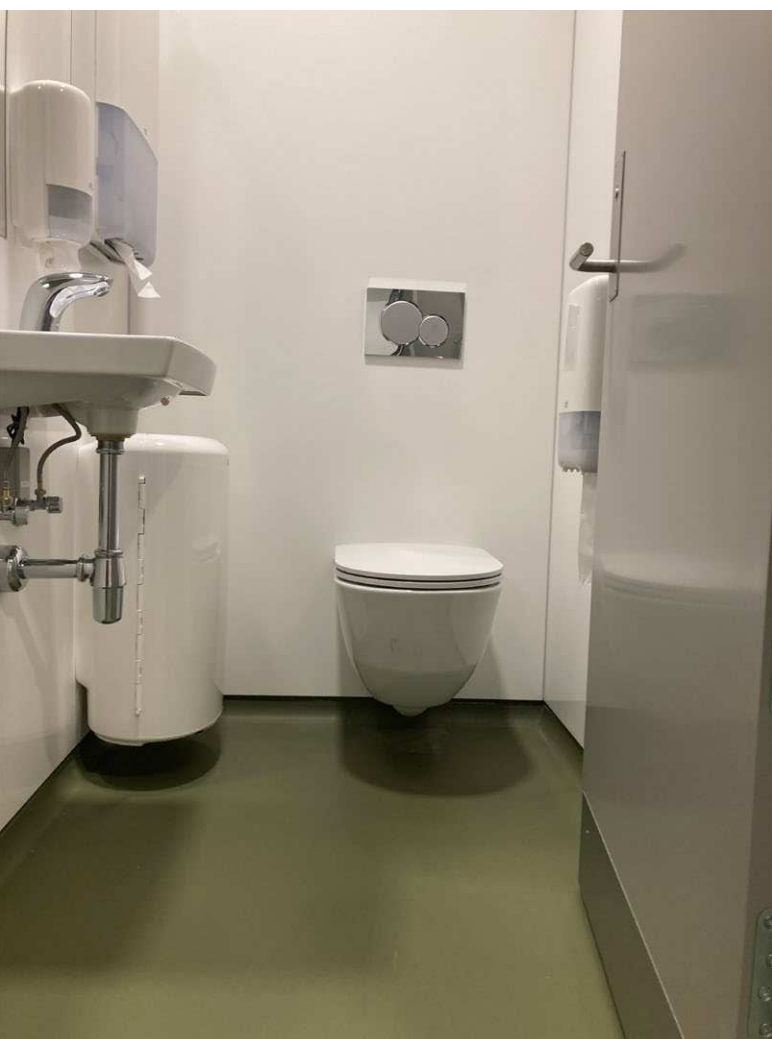
Gulvbelægning med afsluttet gulv med hulkele. Toilettet og øvrigt inventar er væghængt for også at lette rengøringen

Toiletrummetts vægge, gulve, lofter, døre og låse har stor betydning for elevernes oplevelse af deres toiletbesøg. En god oplevelse af rummet kan være med til at mindske de mentale barrierer, der kan være forbundet med toiletbesøg. Farver og god belysning kan dertil forbedre brugeroplevelsen og understøtte hensigtsmæssig adfærd hos eleverne. Materialer og overflader bør samtidigt vælges med tanke på rengøring og robusthed.