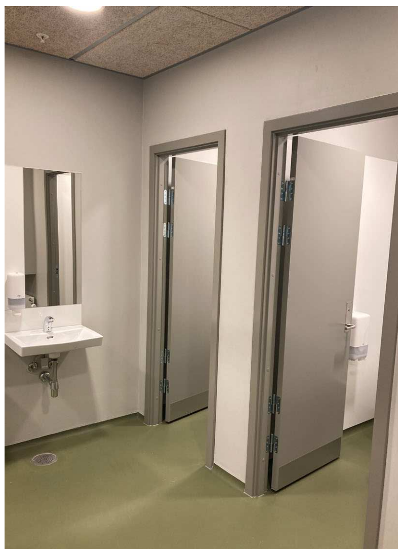
Et eksempel på et godt oplyst forrum i farver.