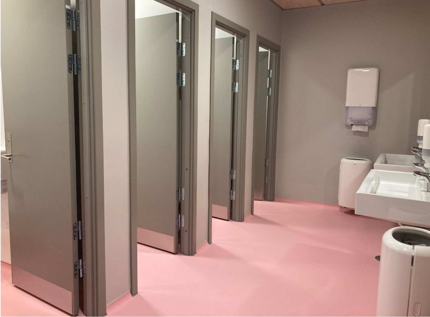
Stort forrum indrettet med håndvaske og med 4 toiletrum på stribe.

Skolernes toiletter bliver brugt af mange elever i løbet af dagen. Derfor er det vigtigt, at toiletterne er placeret tæt på elevernes primære opholdsområder, så alle elever kan nå at komme på toilettet, når de har behov for det. Der til kan toiletter med forrum skabe et godt flow af elever, så tiden på toilettet optimeres.