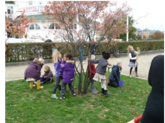
Børn fra børnehaver i indre by planter blomsterløg v. Lad Sørner Blomstre