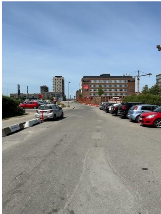
Vejen fra Gammel Køge Landevej og ned til Følager

På den side af vejen, der leder frem til plejehjemmet, er der som nævnt ikke noget fortov. Fodgængere vil derfor være nødsaget til at krydse vejen for at benytte fortovet på den modsatte side, for så at krydse vejen igen, når de skal frem til Solgaven Valbys hovedindgang. Ved rundgang sås det, at en person gik i den side, hvor der ikke er fortov (dvs. på kørebanen), formentlig fordi det er den korteste og mest naturlige vej at følge.