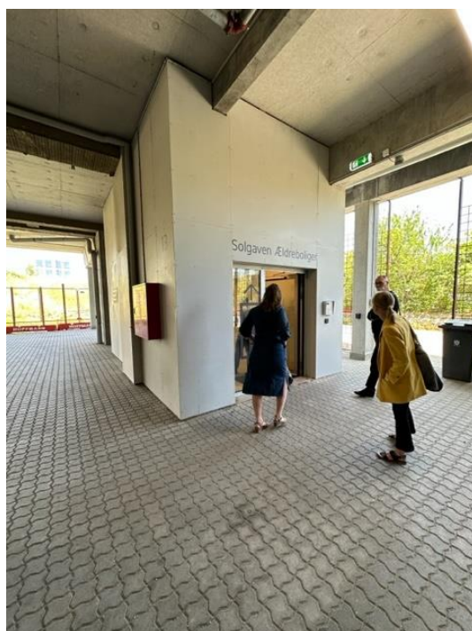
Opgangen til ældreboligerne placeret i parkeringsanlægget

Derudover er det svært at finde opgangen til ældreboligerne, selvom der er placeret et skilt ved indgangen til parkeringsanlægget.