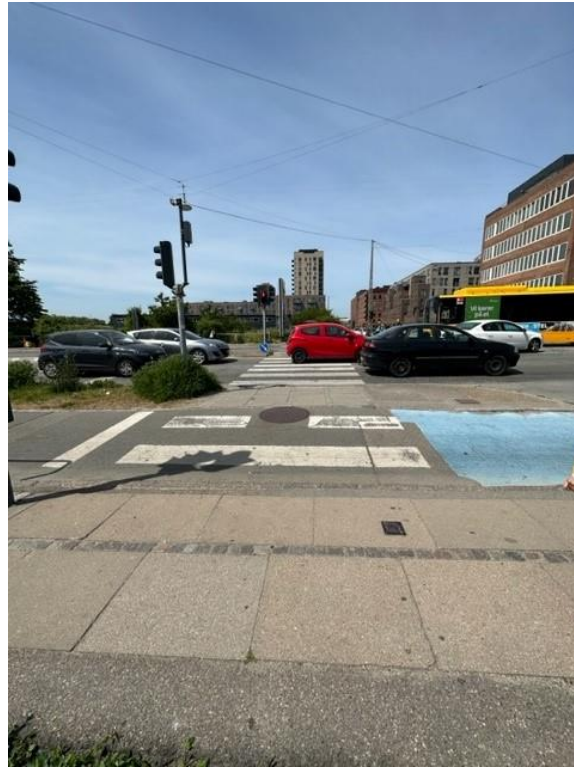
Fodgængerovergang ved Gammel Køge Landevej

På den side af vejen, der leder frem til plejehjemmet, er der som nævnt ikke noget fortov. Fodgængere vil derfor være nødsaget til at krydse vejen for at benytte fortovet på den modsatte side, for så at krydse vejen igen, når de skal frem til Solgaven Valbys hovedindgang. Ved rundgang sås det, at en person gik i den side, hvor der ikke er fortov (dvs. på kørebanen), formentlig fordi det er den korteste og mest naturlige vej at følge.