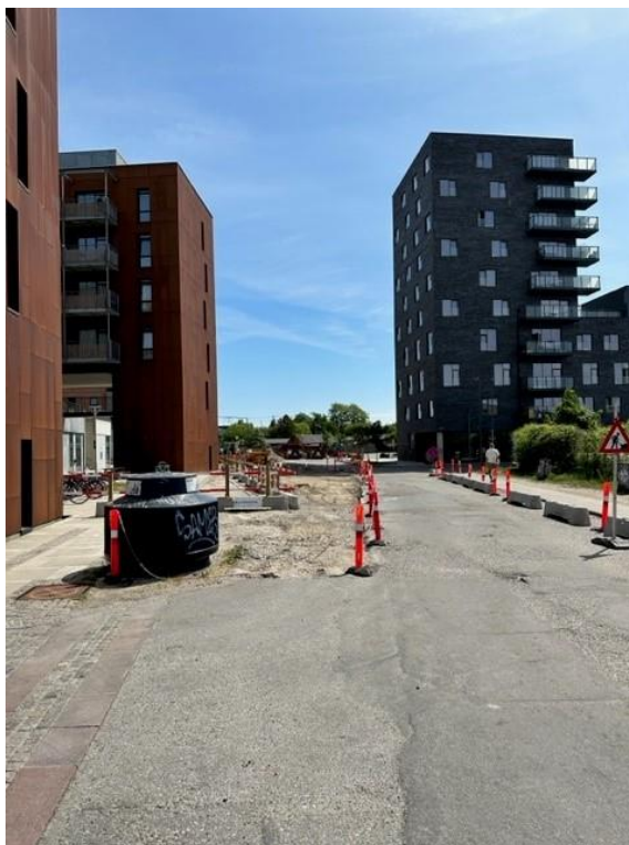
Solgavens hovedindgang ses til venstre for afspærringen

Det er således vanskeligt for beboerne at færdes på selve Følager og på vejen, der leder op til Ny Ellebjerg station og til Gammel Køge Landevej.