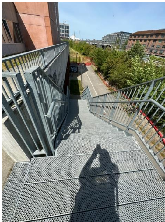
Trappenedgang uden låge

På bagsiden af Solgaven Valby er der en anden trappe, der går ned til terræn, som mangler en låge.