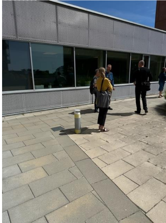
Lampe placeret i gårdhave

I gårdhaven, der leder op til fællesarealet, er der placeret en lampe i 50 cm højde, hvor beboerne færdes.