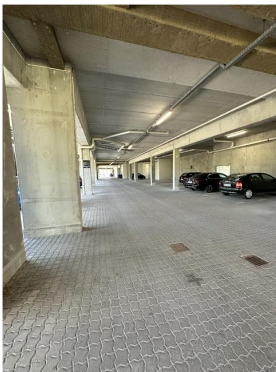
Parkeringsanlægget ved opgangen til ældreboligerne

Derudover er det svært at finde opgangen til ældreboligerne, selvom der er placeret et skilt ved indgangen til parkeringsanlægget.