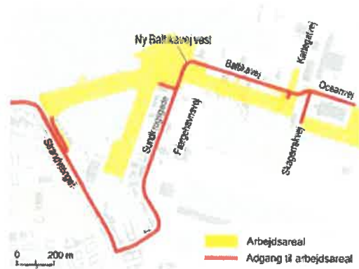
Figur 8.2 En del af Svaneøllehavnen, Kalkbrænderilebet, Svaneknoppen og området omkring Baltikavej, Kattegatvej og Oceanvej vil blive inddraget til arbejdsareal. Der vil være adgang til arbejdsarealerne fra Strandvænget, Sundkrogsgade og Baltikavej.