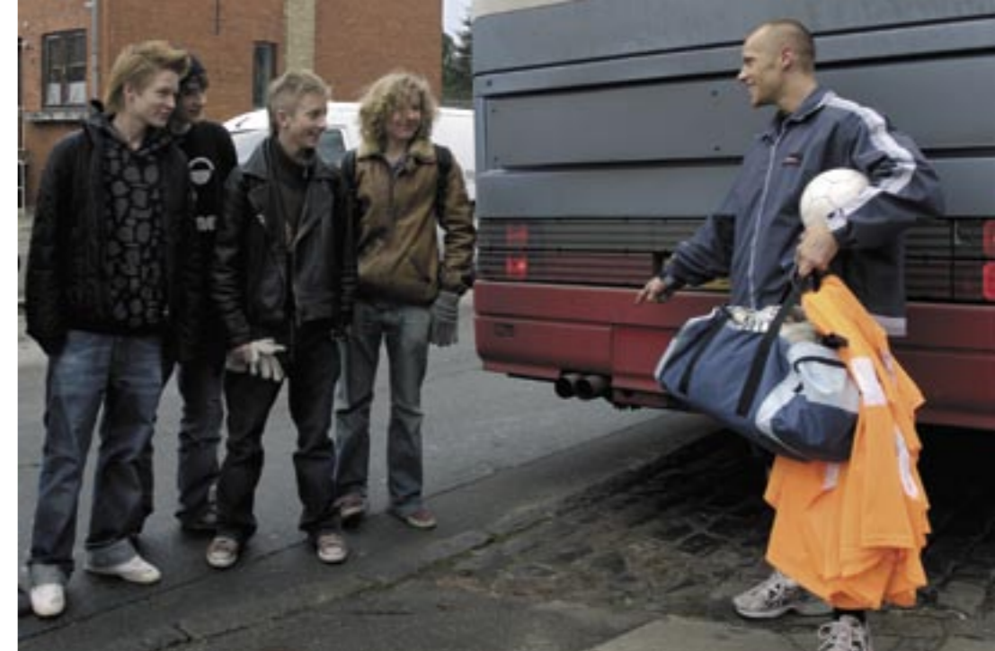
Når eleverne i Københavns Kommunes skoler køres til og fra svømning og idræt, sker det i busser, der er forsynet med partikelfiltre.

Miljøkontrollen stiller spørgsmål om, hvilke stoffer og materialer der indgår i fremstillingen af produktet. Produktet skal leve op til nogle minimumskrav. Det betyder for eksempel, at der ikke må indgå stoffer, der står på Miljøstyrelsens liste over uønskede stoffer. Leverandørerne skal blandt andet arbejde for at udfase PVC og phthalater (blødgørere).