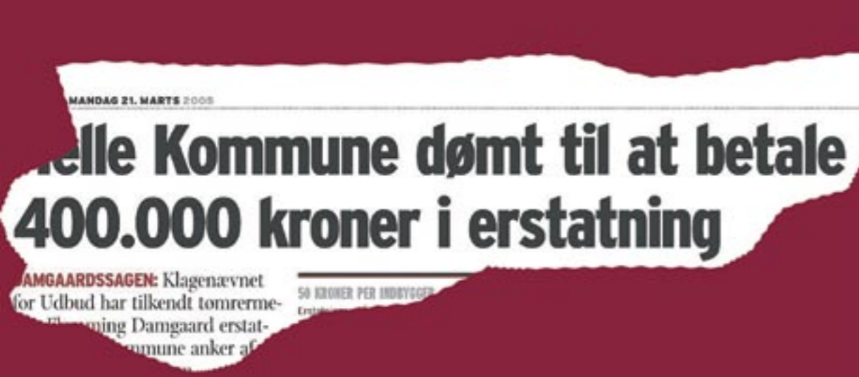
Overskrift i dagbladet JyskeVestkysten